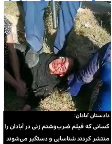
دادستان آبادان: کسانی که فیلم ضرب و شتم زنی در آبادان را منتشر کردند شناسایی و دستگیر می شوند

برپایه خبر منتشره در کانال تلگرامی خوزستان امروز آمده است: حمید مرانی پور، دادستان آبادان، به دنبال واکنش های گسترده به ضرب و شتم و تعرض به زنی در آبادان، گفت: «تحقیقات در مورد کسانی که این فیلم را منتشر کرده و باعث بی امنیتی آبادان شدند، شروع شده و به زودی این افراد شناسایی و دستگیر، برخورد قانونی و لازم با آنها انجام می شود». کتک میزنند، آدم میکشند، شکنجه و سر به نیست میکنند اما به جای آمرین و عاملین این جنایتها به سراغ کسانی میروند که خبر جنایت هایشان را منتشر می کنند. جامعه را نا امن کرده اند اما اگر اخبار ناامنی را منتشر کنیم ما مجرم و باعث نا امنی میسویم.