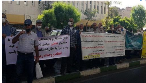
بازنشستگی همچنان ادامه دارد:

برپایه خبرمنتشره؛ در تاریخ روز دوشنبه ۵ آبان ۹۹ آمده است: زیر سایه سکوت خبری مطلق، جمعی از کارگران بازنشسته صنعت نفت در ادامه اعتراضاتشان نسبت به سطح نازل حقوق، عدم همسان سازی حقوق با شاغلان، پرداخت نشدن مطالبات و عملکرد صندوق بازنشستگی دست به تجمع مقابل ساختمان وزارت نفت در پایتخت زدند. قابل یادآوری است که، روز دوشنبه 5 آبان برای چهارمین بار در سال جاری، ایثارگران از کارافتاده شاغل در وزارت نفت هم برای انعکاس صدای اعتراضاتشان نسبت به پایمالی حقوقشان دست به تجمع مقابل وزارت نفت زده بودند.